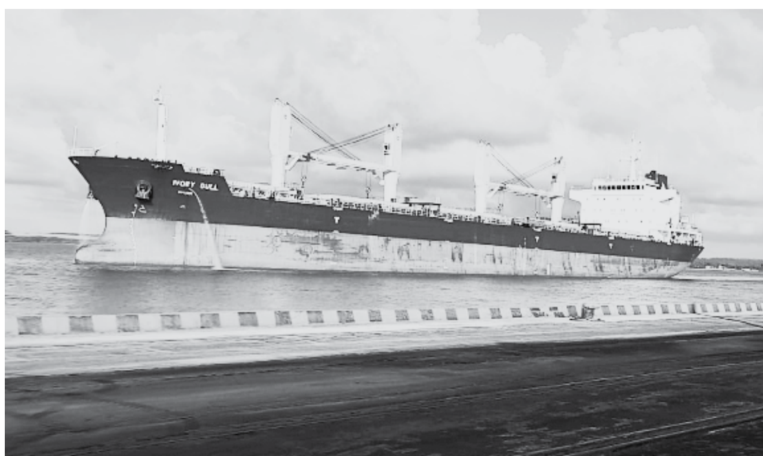
Carga de sal marinho veio do Rio Grande do Norte e será embarcada no porto paraibano com destino à Europa