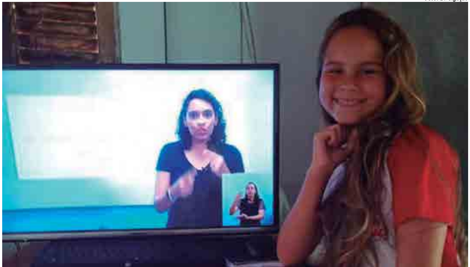
Para garantir o ensino dos estudantes da rede municipal, Secretaria de Educação de João Pessoa desenvolveu uma plataforma e firmou parceria com a TV Câmara