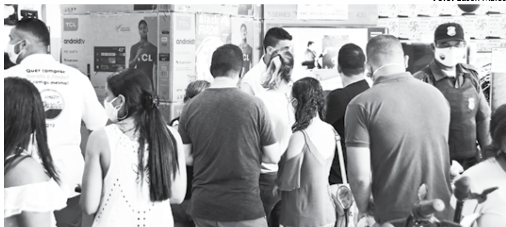
O movimento no Centro e em hipermercados causou aglomerações, mesmo com máscaras e distribuição de álcool