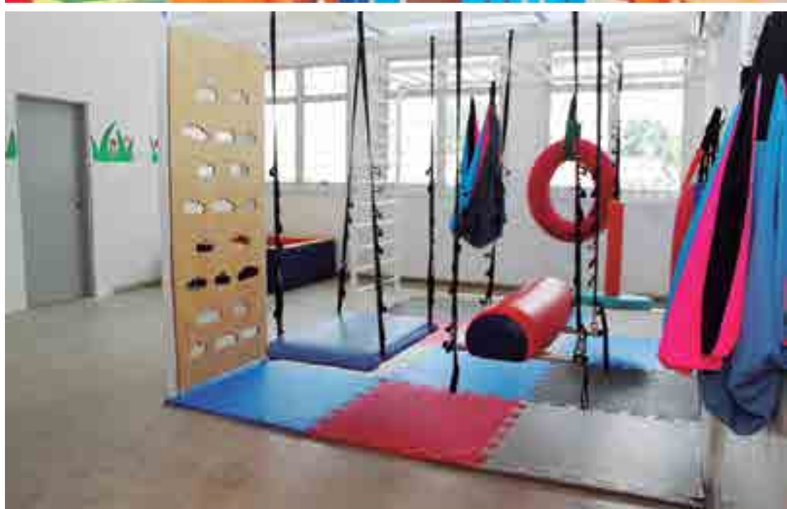
João Azevêdo inaugurou o Centro que possui toda a infraestrutura e equipe multidisciplinar para atender os autistas