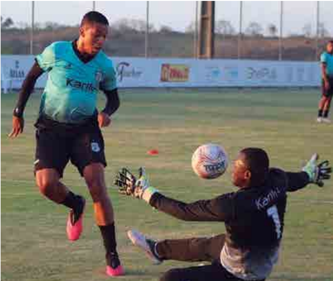
Para o Treze, só a vitória contra o Vila Nova interessa para continuar na luta para fugir do rebaixamento